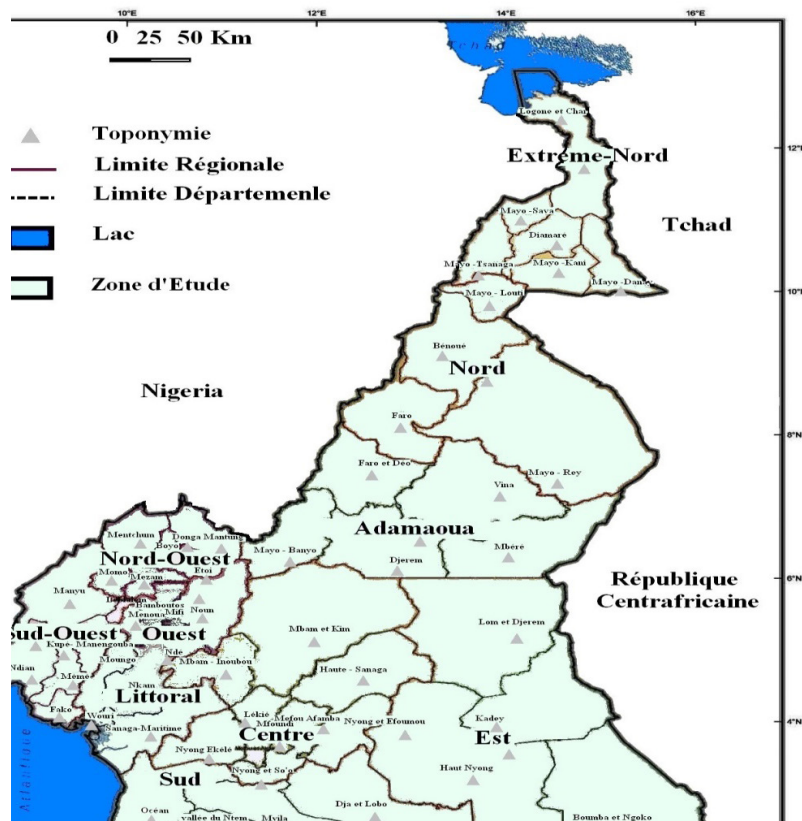
Figure 1 : carte de localisation

La carte ci-dessous géolocalise le Cameroun :