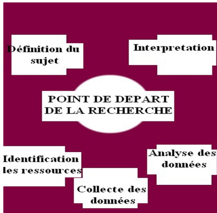
Figure 2: principe méthodologique

La présente figure met en exergue le schéma méthodologique de notre étude, car celle-ci détermine la relation identique qui s'observe entre les différentes procédures allant du point de départ de la recherche qui s'interprète par la compréhension du sujet, l'identification des ressources puis la collecte des données ensuite de l'analyse des données et l'interprétation des résultats obtenus.